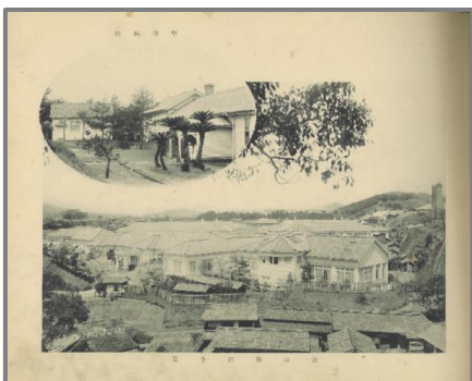
学用病院 (上) 長崎病院全景 (下)