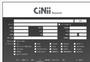
CiNii Research (日本の大学図書館)