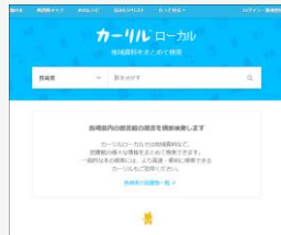
カーリル ローカル (長崎県内の図書館)