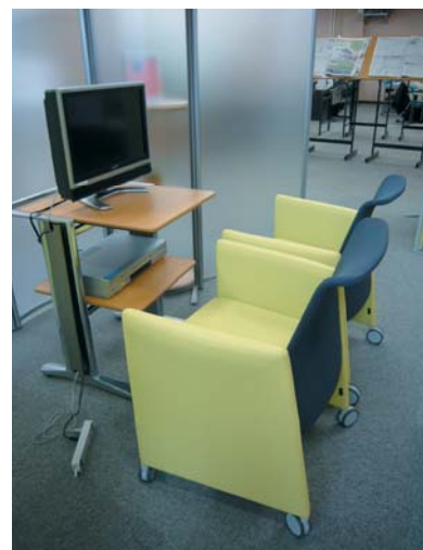
中央図書館AVコーナー