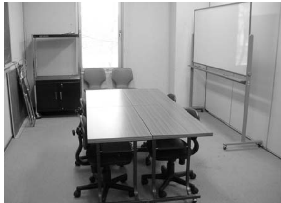
<Sサイズ(収容人数 約5名)>