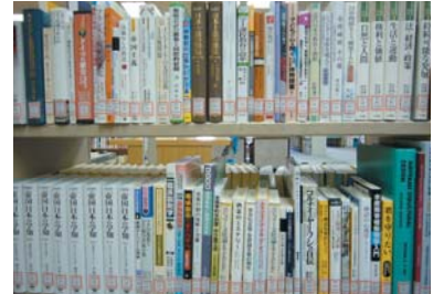
新着図書(中央図書館)