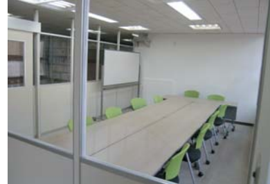
経済学部分館グループ学習スペース