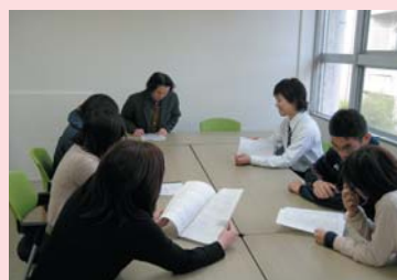
先生を囲んで明るいグループ学習スペースで実施されるゼミの風景

○経済学部分館では、トイレの改修に続いて、2階にグループ学習スペースを設置しました。これからもさらに利用しやすい学習環境を提供していきます。詳しくは、本文をご覧ください。 ○経済学部分館では、3月1日より現在の午前9:00からの開館時間を、午前8:40からに20分間早く開館することにいたします。これまで以上に図書館をご利用ください。