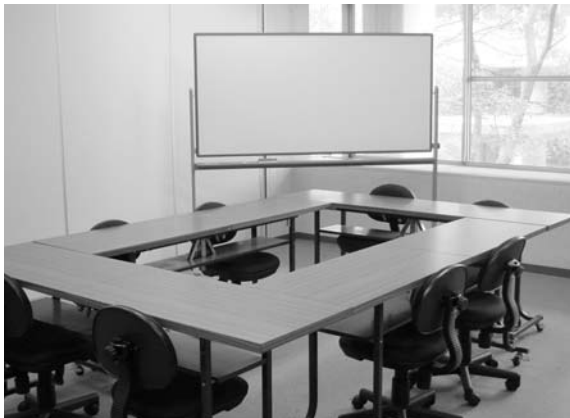
<Lサイズ(収容人数 約10名)>