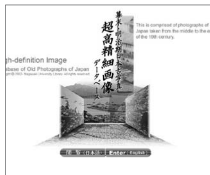
幕末明治期日本古写真超高精細画像データベース http://zoomphoto.lb.nagasaki-u.ac.jp/