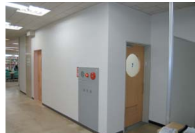
経済学部分館トイレ入り口