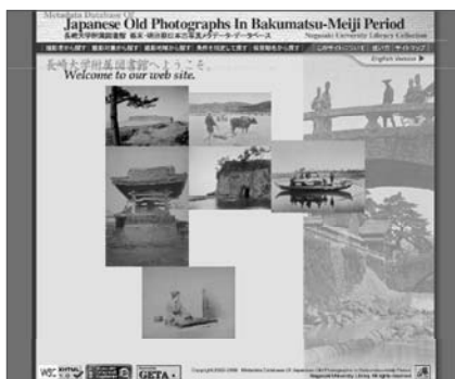
幕末・明治期日本古写真データベース (日本語版) http://oldphoto.lb.nagasaki-u.ac.jp/jp/

附属図書館が提供する「幕末・明治期日本古写真データベース」と「幕末明治期日本古写真超高精細画像データベース」へのアクセス件数が、平成10年10月からの累積で100万件を突破しました。両データベースとも、日本語版のほかに英語版も提供しており、国内のみならず、海外からのアクセスが多いのが特徴です。