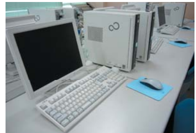
新しくなったパソコン